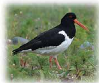
Pioden Fôr / Oystercatcher